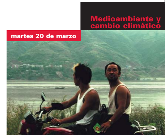
Medioambiente y cambio climático

Fengjie fue una aldea, que resultó inundada tras la construcción de la presa de las Tres Gargantas, en China. A la vez se construyó un nuevo lugar para la población. El minero Han Sanming vuelve al pueblo a buscar a su mujer, a la que no ha visto en 16 años. Por otro lado, Shen Hong , una enfermera, busca en Fengjie a su marido, que se marchó de casa dos años atrás... Es la historia de amor de "La buena gente de las tres gargantas", la vida de dos parejas separadas que se reencuentran en un pueblo irreconocible. La película recoge con gran belleza, sensibilidad y melancolía las relaciones entre las personas que, a pesar de los conflictos, intentan buscar la felicidad en medio de la soledad y del abandono, al tiempo que el pueblo desaparece sumergido en parte bajo las aguas.