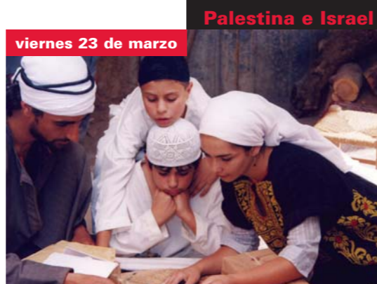
viernes 23 de marzo

Palestina, 1914 con el trasfondo de la aparición de los primeros "kibbutz" y el fin del dominio turco, una mañana de julio, Soliman , un joven palestino, y su amigo judío, Jacob , comienzan a edificar una casa en Beit-Sajour, en las colinas de Judea, con piedras traídas de Beit-Yala. La aparente quietud del lugar es interrumpida por ráfagas de violencia que anticipan los futuros días de la guerra y de las alambradas y los muros que separan a las personas. En su película, rodada en Palestina e Israel con no pocas dificultades, Miguel Littin busca sus raíces árabes, mostrando historias que escuchó de niño, e indaga en el conflicto de estas tierras. El director opina que su película es un modo "de contribuir a la paz y al entendimiento en Oriente Medio" ya que considera que "el arte puede ser el nexo de unión" entre judíos y palestinos.